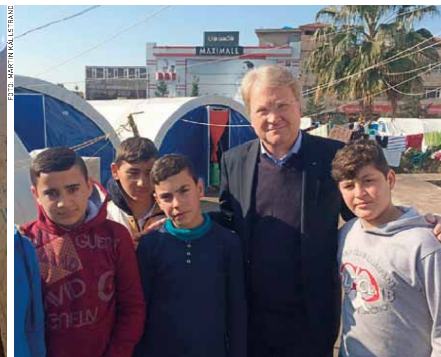
På besök i ett flyktingläger i Erbil.