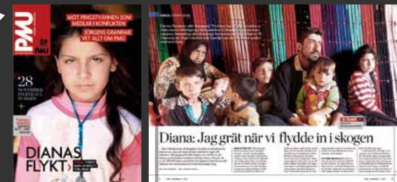
PMU-tidningen, december 2015.