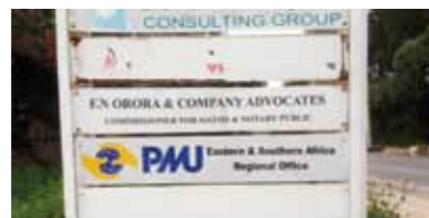
Här har PMU sitt fältkontor.