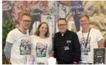
PMU på plats i montern.

På facebook håller vi dig ständigt uppdaterad kring aktuella händelser, frågor vi driver och hur det går för våra partners ute i världen.